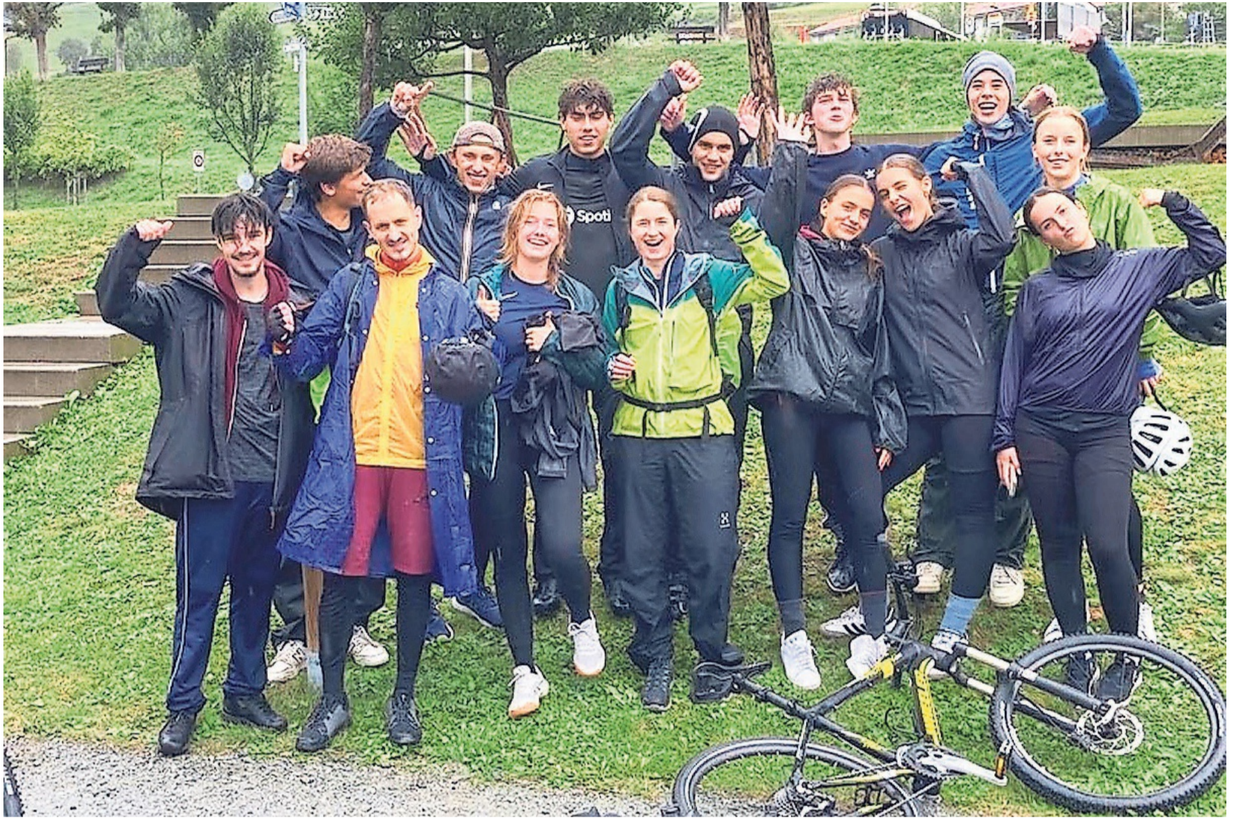
Geschafft! Die Kantonschülerinnen und -schüler waren 24 Stunden lang in der Fortbewegung – zu Fuss, mit dem Velo und auf Inlineskates.

Nicht einfacher wurde es, als wir den Anstieg im Prättigau bezwingen mussten. Durch Frage-Antwort-Spiele versuchten wir, uns über längere Zeit wach zu behalten. Doch irgendwann war die Müdigkeit so gross, dass uns sogar das Sprechen zu schwer fiel. Gegen 5 Uhr morgens war der Tiefpunkt erreicht. Uns plagten Krämpfe, Sekundenschlaf und Erschöpfung. Es kamen uns ernsthafte Zweifel, ob wir es schaffen würden, denn es war ja erst gerade Halbzeit! Ein aufmunternder Anblick bot sich uns erst, als unsere Begleit-