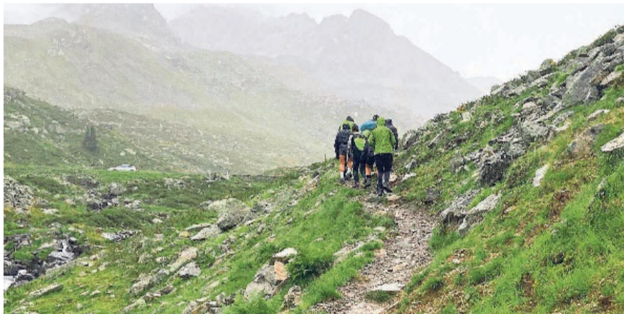
Kälte und Nässe sind keine gute Kombination – wenn dann auch noch Müdigkeit dazukommt.

fahrer beim Etappenziel in Klosters ein kleines Frühstück vorbereitet hatten.